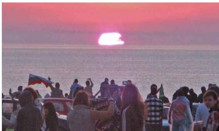
Посрещане на Джулая през 2007 г. с участието на Джон Лоутън, изпял July morning по време на изгрева.

Джулая (или нечленувано Джулай /англ. юли/, по името на известната песен на Uriah Heep от 1971 г. July Morning) е най-традиционният хипи празник в България, възникнал във Варна в края на 70-те години на миналия век. Традицията съществува и до днес и доביва все по-широка популярност сред младите хора. На всеки 30 юни срещу 1 юли големи групи хора се събират по цялото Черноморие, за да посрещнат заедно слънцето, което изгрява над морето. Така те смятат, че се пречиствам пред него, без това да има връзка с