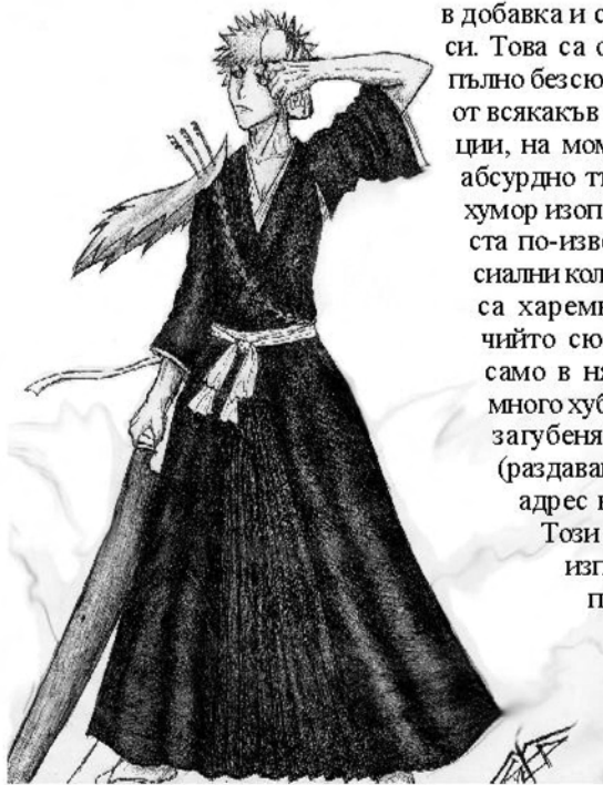
Ичиго Курасаки от Блийч (Ichigo Kurosaki from Bleach)

Норог или хорър (ужаси, букв. прев.) - могат да се определят само с няколко думи - кръв (в промишлени количества), екшън, смърт, чудовища и неочаквани обрати в сюжета. Често този жанр се преплита с мистъритата (мистериите) - анимета, в които сюжетът е извъртан по един наистина майсторски начин, а краят е неизвестен и абсолютно непредсказуем (хубавият край не е задължителен, да се разберем!).