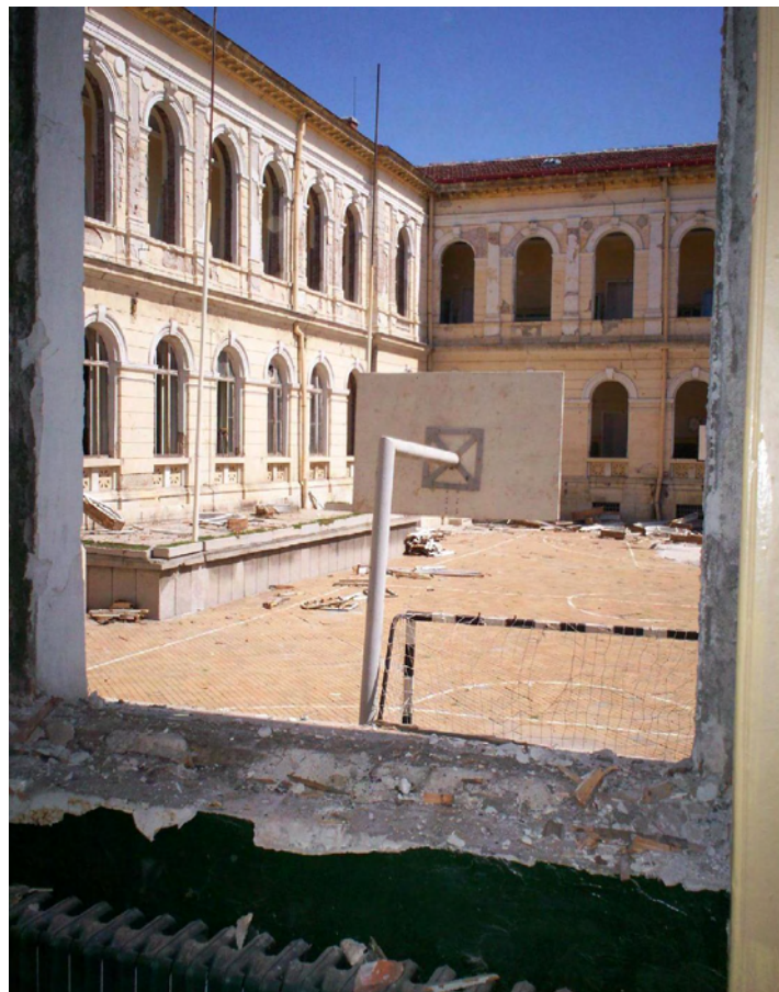
„Майсторските“ бригади на софийска фирма и през октомври ще работят в СОУ „Христо Ботев“. Позакъснялата смяна на дограма (за над 200 хил. лева) съсипе 100-годишния паметник на културата. Около прозорците зият огромни дупки. Учениците са разпилени по три училища, заради необитаемата сграда. Има куп обещани и пропуснати срокове. Класни стаи за уроци няма. Дали пък стачката не е добре дошла...