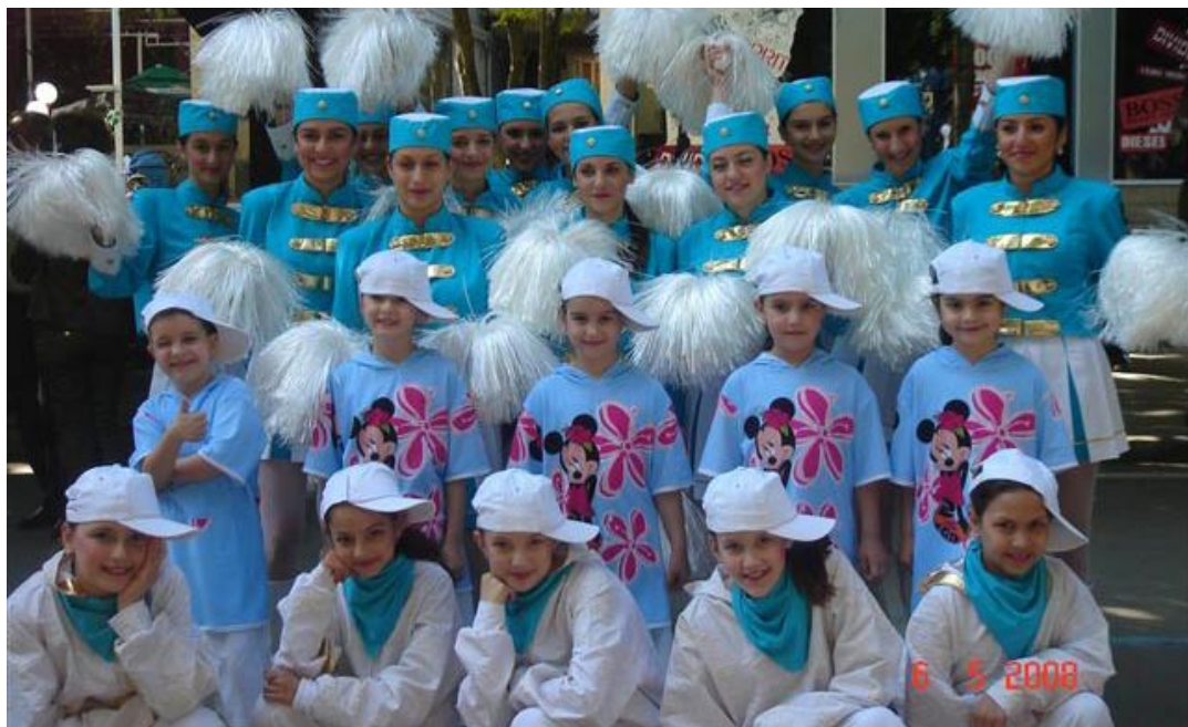
Мажоретният състав към центъра вече е търсен и изявите му набират скорост.