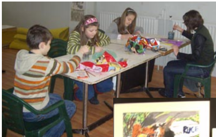
Малките художници от школата в ателието на ул. „Борисова“ №53.

Много отличия завоюват децата от школата и в конкурси с чисто русенско звучене и обявени от местни организации, фирми и институти – „Моята библиотека“,