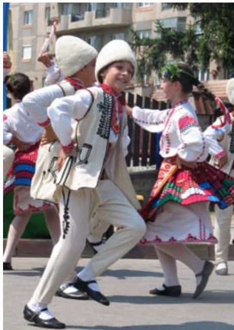
Момите ситно ситнеха, ергени снаги кръшеха... Изпълнение на танцьори на „Русчуклийче“.

„Запазваме прекрасен спомен от Вашето пребиваване в Квебек и изразяваме нашето възхищение от Вашите танци, от красотата на националните Ви костюми, от яркото Ви артистично присъствие! Благодарим!“ – г-н Йен Роае, президент на фестивала в Бопорт-Квебек, Канада