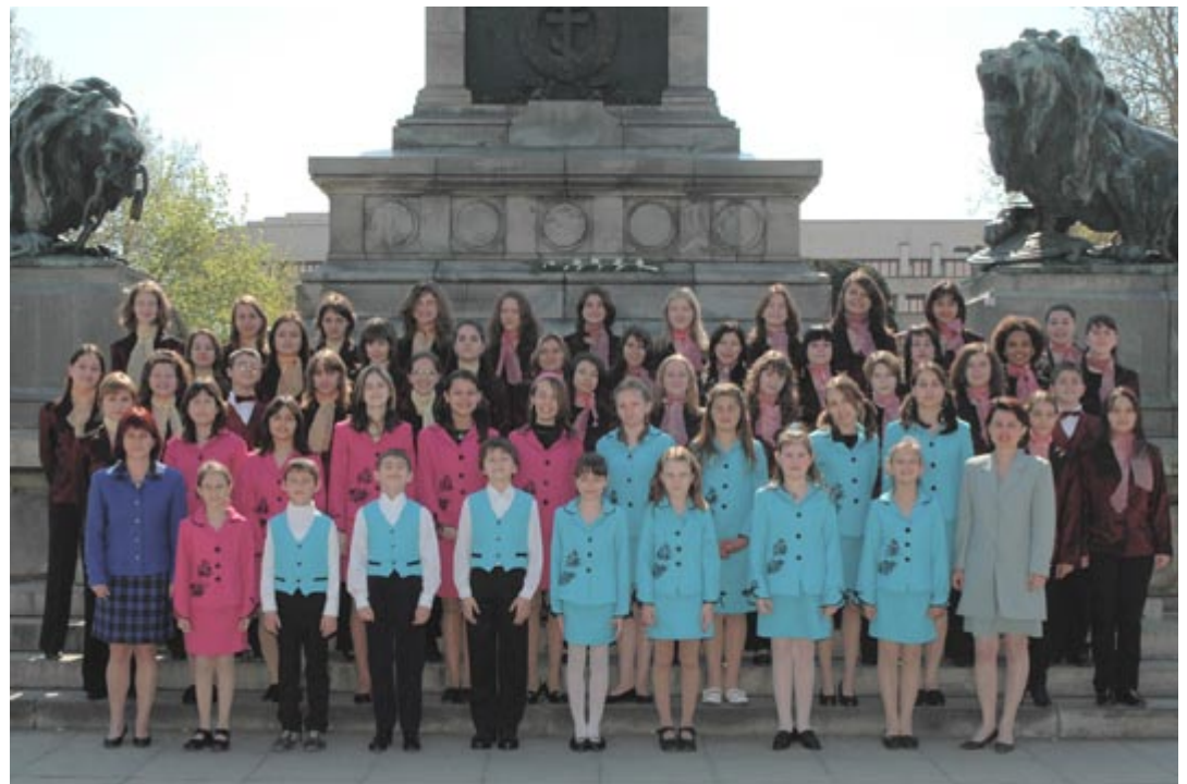
ДДХ „Дунавски вълни“ пред Паметника на свободата в родния град Русе.

Надяваме се новите хористи в бъдеще да бъдат така отдадени на любимото изкуство както предшествениците си и да продължат традициите на хор „Дунавски вълни“, така че достойно да звучи химнът ни: „Родна песен нас на век ни свързва!“, въодушевени са възпитаниците на хора.