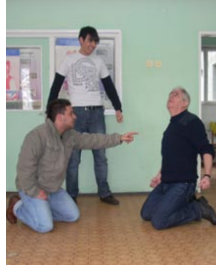
С постановката на „Михал Мишкоед“ от Сава Доброплодни студиото спечели голямата награда на конкурса „Климент Михайлов“ м.г.