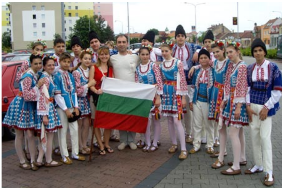
„Здравец“ – след поредната си извоювана с майсторство международна награда.

„...духът на радостта и всеотдайността, с които споделяте таланта и традициите си, носят голяма наслада на всеки, който гледа представлението ви.“ – Роналд Рейгън, президент на САЩ, август 1987 г.