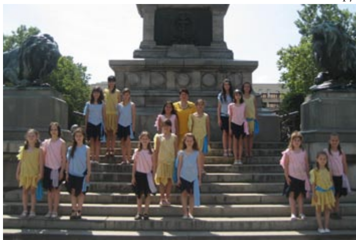
Част от младите изпълнители от „Слънце“.

Децата са благословени лично от патриарха на Румъния Теоктист.