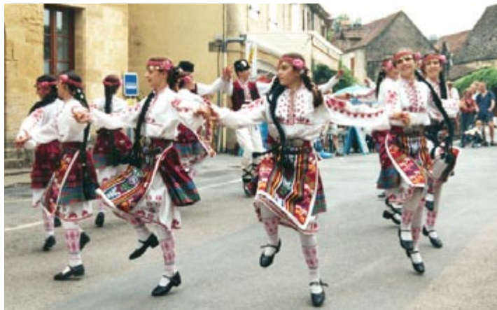
Танцьорите на „Зорница“ във вихъра на танца пред чуждестранна публика.

В ансамбъл „Зорница“ традицията е целият колектив да празнува Нова година, Денят на самодееца – 1 март, заедно да се изпращат абитуриенти, честват рождени дни и др.