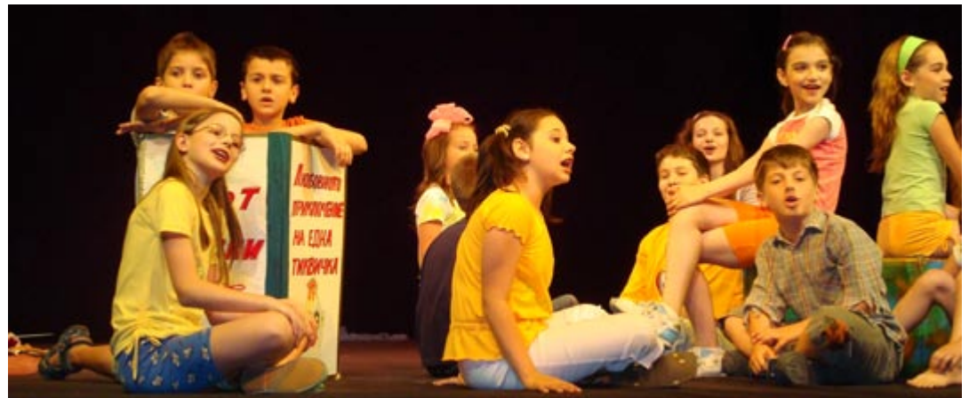
Детската театрална работилничка вече редовно обира първите награди на фестивалите.