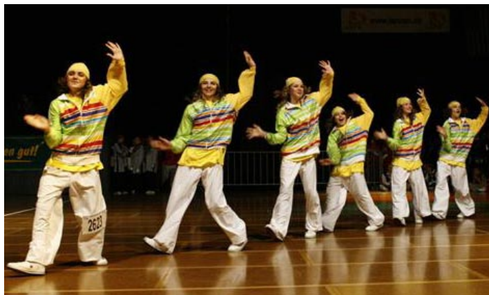
Балетът в ритъма на денс и хип-хоп музиката.