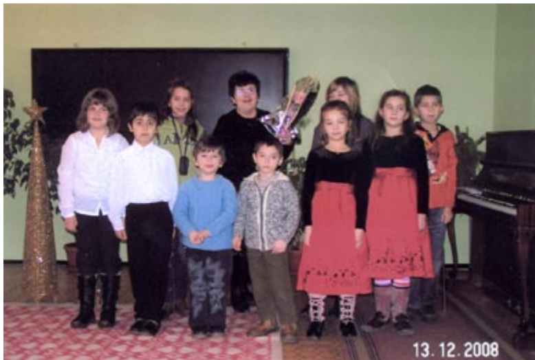
Млади пианисти от най-новата вълна в Школата по пиано.