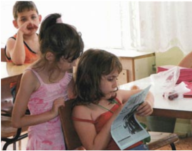
Деца от клуб „Приятелите на книгата“ четат вестник „Екип 101“ по време на летния ученически лагер м.г.

вестник „Рикчо“ и детското списание „Пчелица“, където се публикуват много от детските литературни творби.